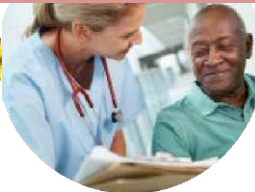
Infirmier santé travail