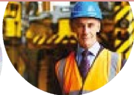
Technicien en hygiène et sécurité